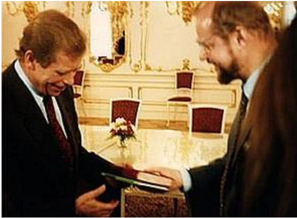
Präsident Václav Havel am 15. März 1991 in Prag mit 15 Mitgliedern der Gesellschaft.