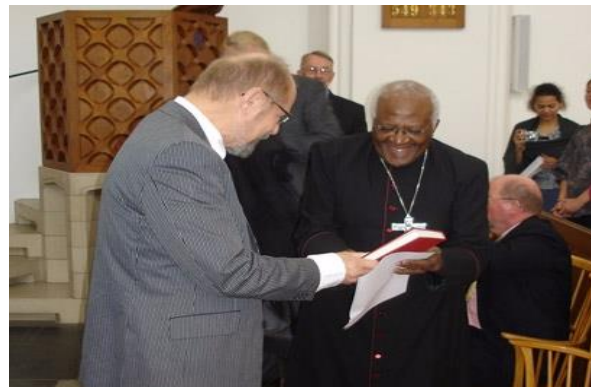
2007 An Erzbischof Desmund Tuto für seinen mutigen Einsatz gegen Apartheid und für Vergebung und Versöhnung. Desmund Tutu und Svend Aage Nielsen Nov. 7, 2007, London.